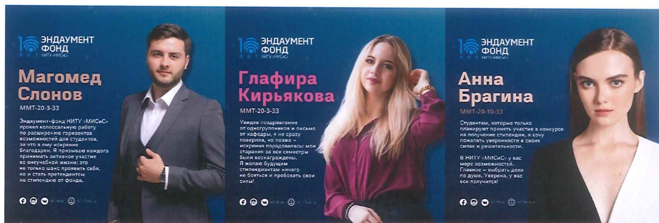
Рисунок 4-6 — Победители стипендии им. В. А. Арутюнова