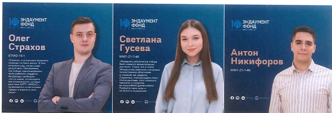
Рисунок 7-9 — Победители стипендии ПАО «ТМК» им. А.Д. Дейнеко