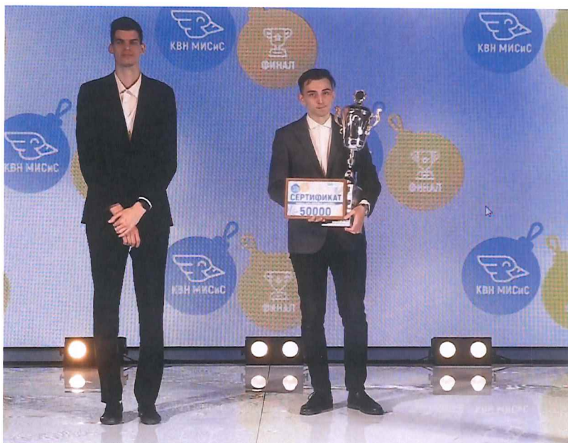
Рисунок 10 — Победитель Кубка «КВН МИСиС» 2020 года

Сведения о порядке расчета объема средств, направленного на реализацию проектов развития НИТУ «МИСиС», дохода от доверительного управления имуществом, составляющим ЦК №1, за 2011–2021 годы, представлены в Таблице 6.