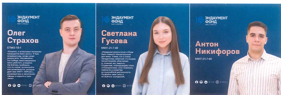
Рисунок 7-9 — Победители стипендии ПАО «ТМК» им. А.Д. Дейнеко

Сведения о порядке расчета объема средств, направленного на реализацию проектов развития НИТУ МИСИС, дохода от доверительного управления имуществом, составляющим ЦК №1, за 2011–2022 годы, представлены в Таблице 7 .