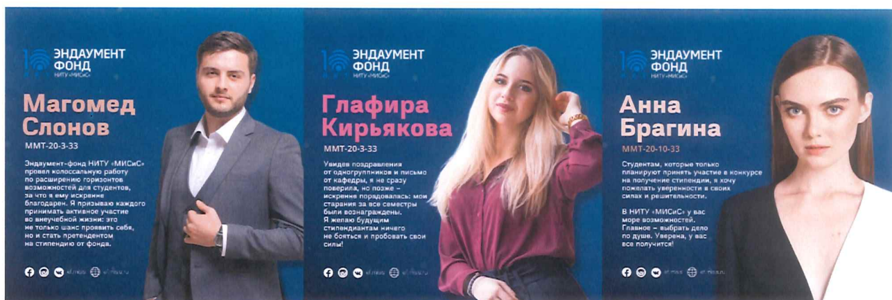
Рисунок 4-6 — Победители стипендии им. В.А. Арутюнова