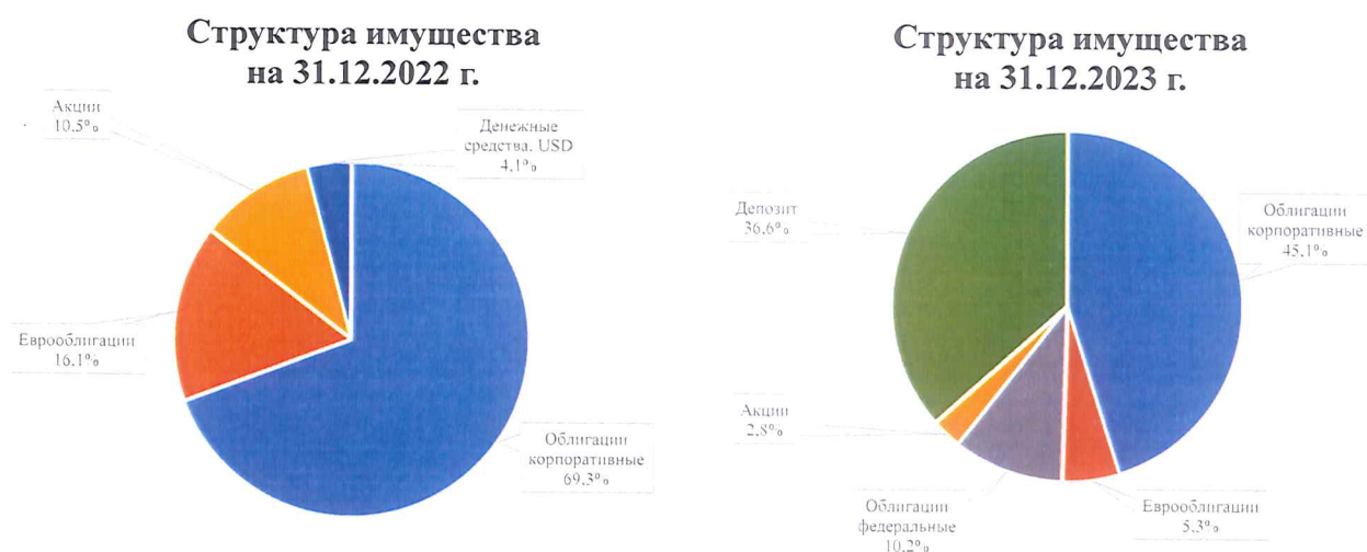
Рисунок 2-3 – Структура имущества, составляющего ЦК №1, на начало и конец отчетного периода