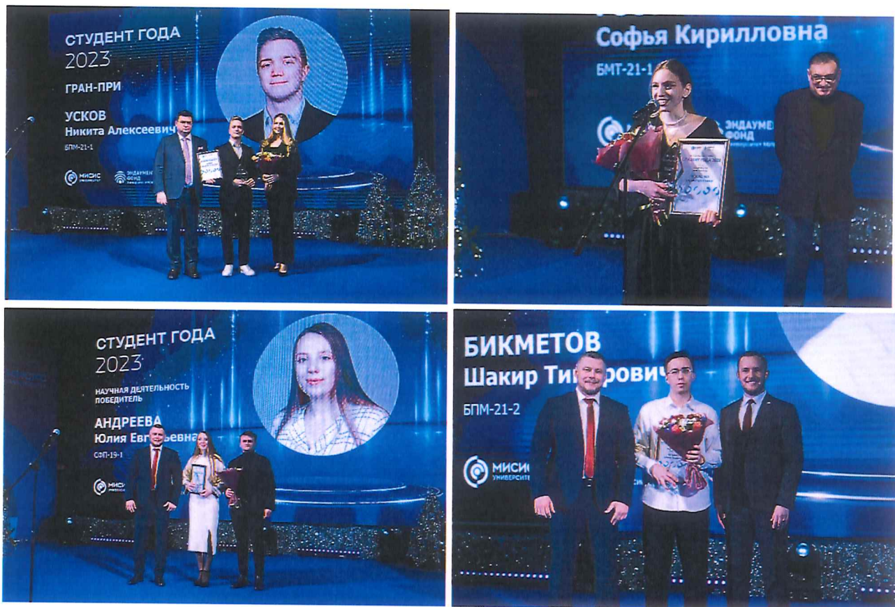
Рисунок 8-11 – Награждение победителей конкурса «Студент года» в г. Москва