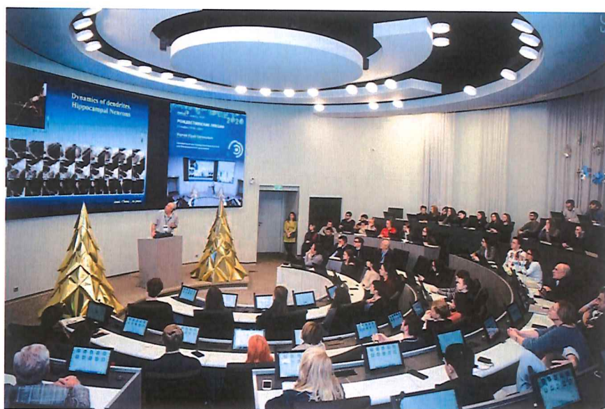
Рисунок 7 — Рождественские лекции в НИТУ «МИСиС»