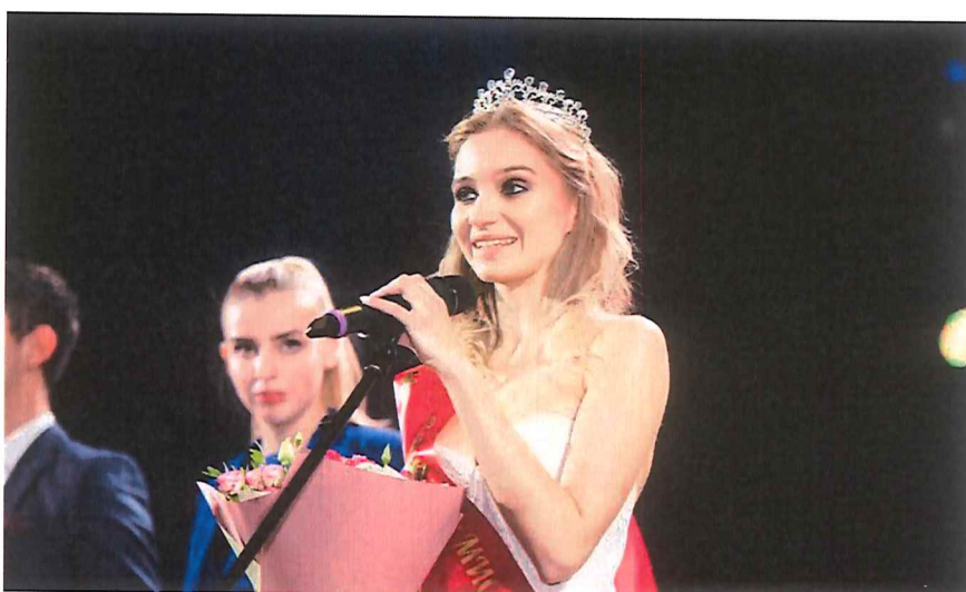
Рисунок 6 — Награждение победительниц конкурса «Мисс «МИСиС» — 2019