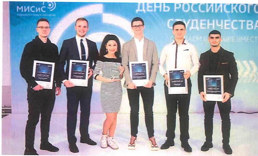
Рисунок 6 – Награждение победителей конкурсов «Студент года» и «Аспирант года»

По итогам конкурса в 2019 году победителями стали: