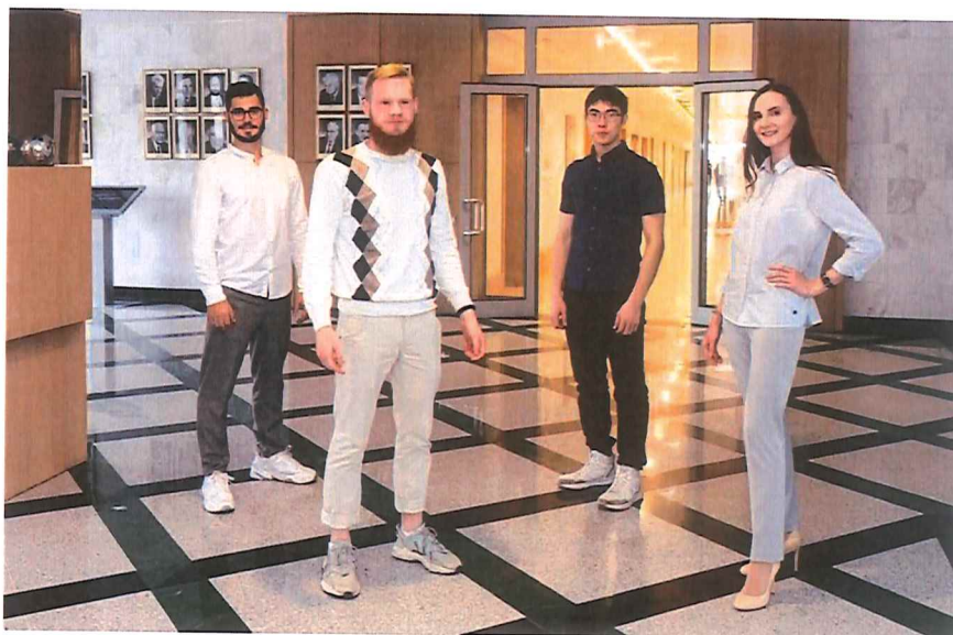
Рисунок 8 — Победители стипендии ГК «МетПром» имени Е. Ф. Вегмана