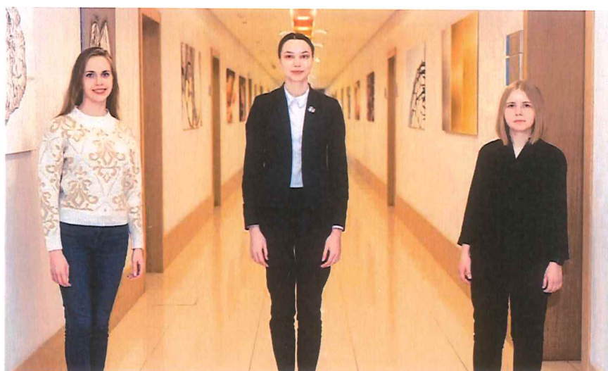
Рисунок 9 — Победители стипендии им. В. А. Арутюнова